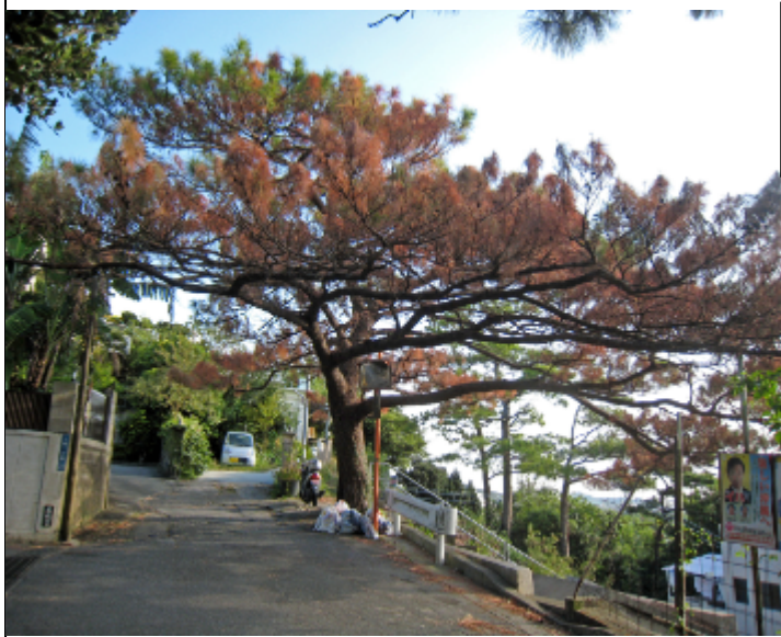
上間1丁目部落の枯れた松

環境部長答弁 松くい虫対策は、自然保護や都市景観上必要だと認識しております。議員ご提案の横断的な対策チームの立ち上げについては、関連部門でも必要性を認識しておりますので、今後前向きに取り組んでまいりたいと考えております。