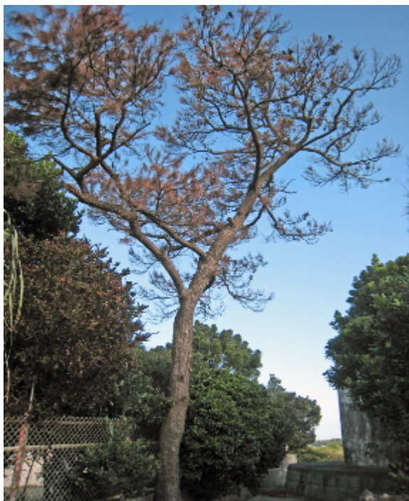
識名4丁目タンク前の枯れた松