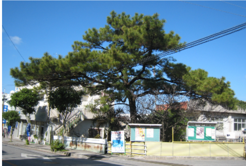
繁多川2丁目のウフカー に立つ松の大木